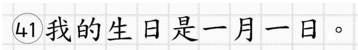
Рис.18. Образец написания иероглифических знаков

Бланк ответов № 2 (лист 1 и лист 2) по китайскому языку (рис. 16 и рис. 17) предназначен для записи ответов на задания с развернутым ответом по китайскому языку (строго в соответствии с требованиями инструкции к КИМ ЕГЭ и к отдельным заданиям КИМ ЕГЭ). Каждый иероглифический знак и каждый знак препинания следует писать внутри отдельной клетки в поле ответов бланка ответов № 2 (дополнительного бланка ответов № 2) (рис. 18).